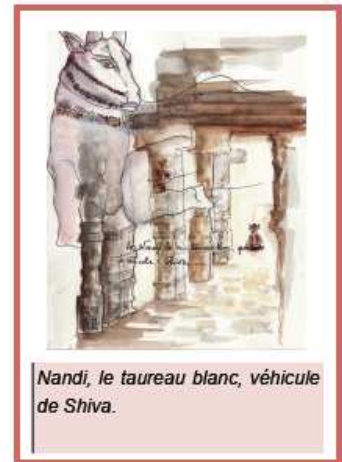
Nandi, le taureau blanc, véhicule de Shiva.