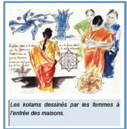
Les kolams dessinés par les femmes à l'entrée des maisons.