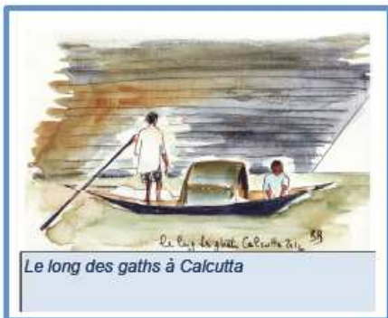
Le long des gaths à Calcutta