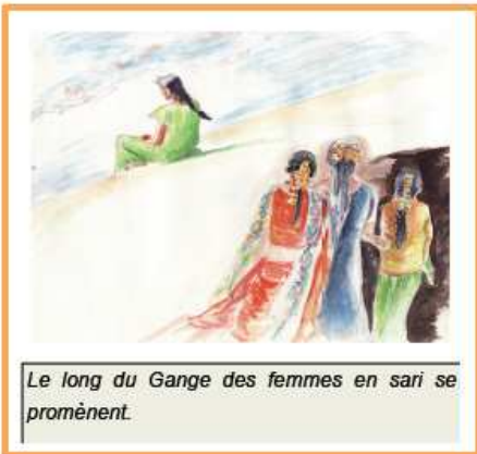
Le long du Gange des femmes en sari se promènent.