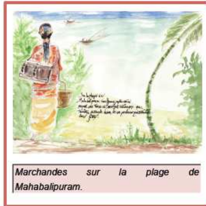
Marchandes sur la plage de Mahabalipuram.