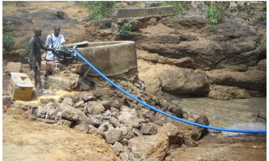
A GLADA : installation d'une pompe.