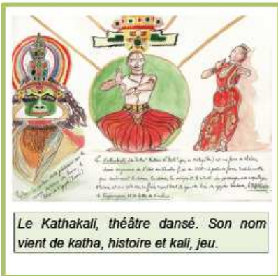
Le Kathakali, théâtre dansé. Son nom vient de katha, histoire et kali, jeu.